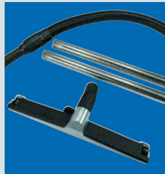
inklusive umfangreichem Zubehör