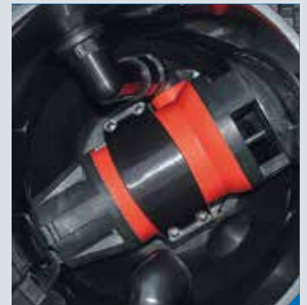
integrierte Tauchpumpe (230 l/min) mit Storz C-Kupplung